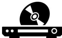
CD・DVDプレイヤー 一式一単位/500円 (2)