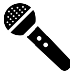
無線マイク 一本一単位/400円 (4)