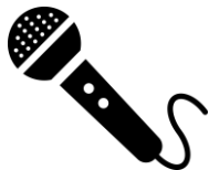
有線マイク 一本一単位/200円 (6)