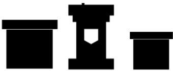
演台・司会台・花台一式 一式一単位/300円 (1)